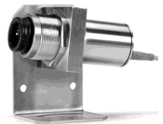
Sirius mit Haltewinkel HA11